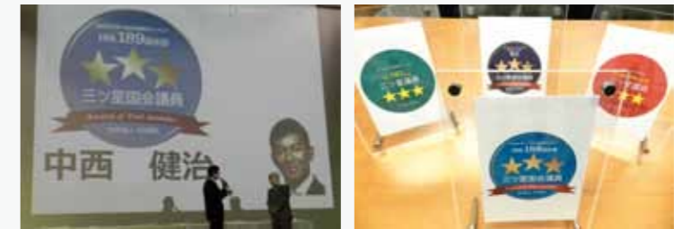
田原総一郎会長より授与される

また、3年に1度行われる「国会議員質問力ランキング」(2013年)では参議院議員、全242人中総合1位を獲得し、「質問回数が多い議員でありながら、質問内容でも評価されている事には大きな価値ある」と評価されています。